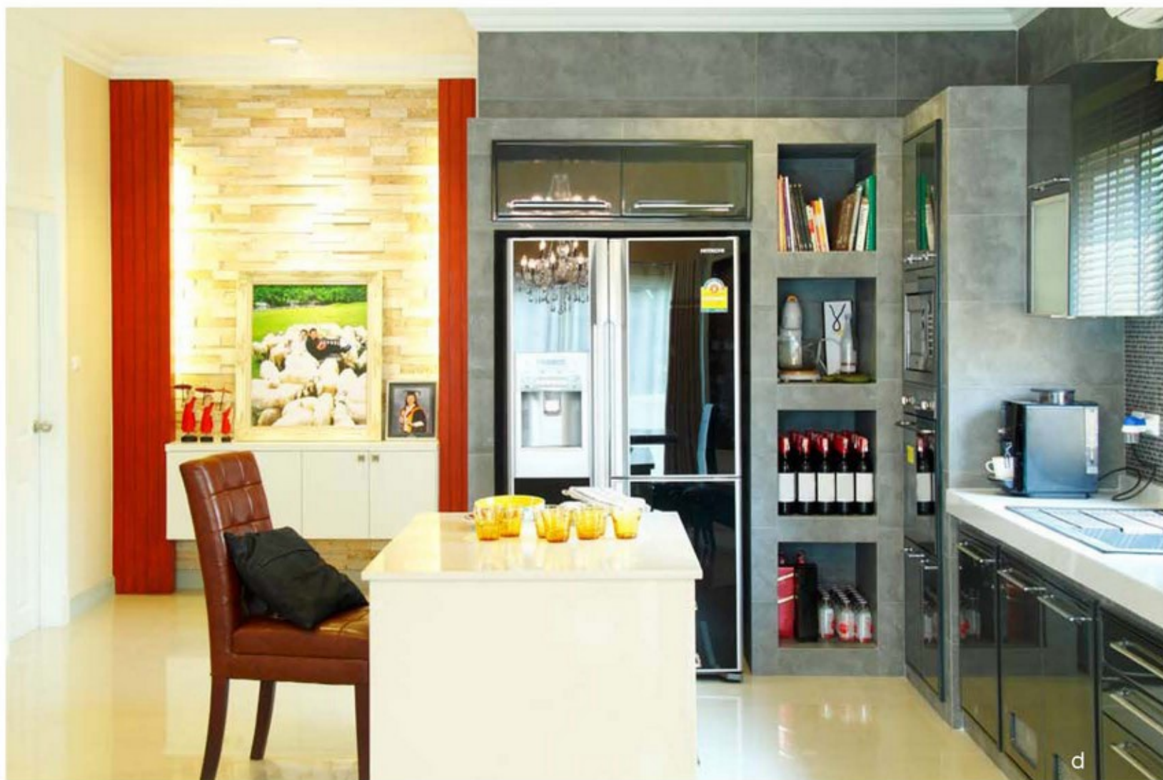
d. ส่วนครัวก็เชื่อมต่อกับประตูทางเข้าบริเวณลานจอดรถ สร้างจุดดึงดูดสายตาด้วยนิวกาชาวน้ำผ่านเข้าตกแผ่น ด้วยหินธรรมชาติและไม้ระแนง

คุณบี ผู้ออกแบบกล่าวว่า “ด้วยโจทย์ของเจ้าของบ้านที่ต้องการความรู้สึกริมน้ำและต้องการกันแอร์ให้เป็นสัดส่วนตามการใช้งาน เราจึงออกแบบเป็นแบบประตูบานเฟี้ยมที่สามารถพับเก็บได้โดยมีช่องเก็บเป็นตู้บิลด์อินกลมกลืนไปกับผนังและส่วนอื่นๆ ของบ้าน”