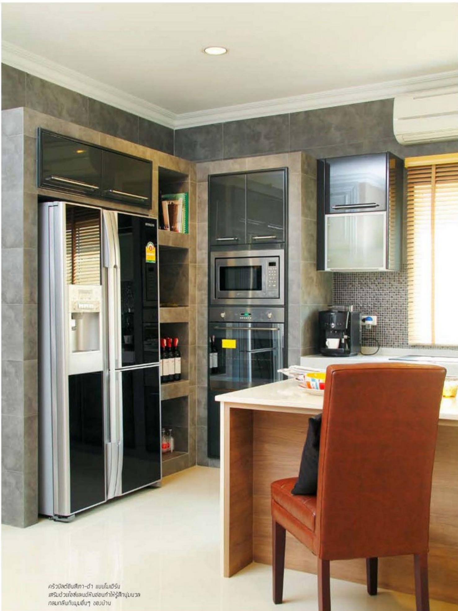
ครัวนิลตีฮินสีทา-ดำ แบบโมเดิร์น เสริมด้วยไอซ์แลนด์หินอ่อนทำให้รู้สึกนุ่มนวล กลมกลืนกับมุมอื่นๆ ของบ้าน